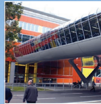
Verbindungsbrücke Luisenforum, Wiesbaden